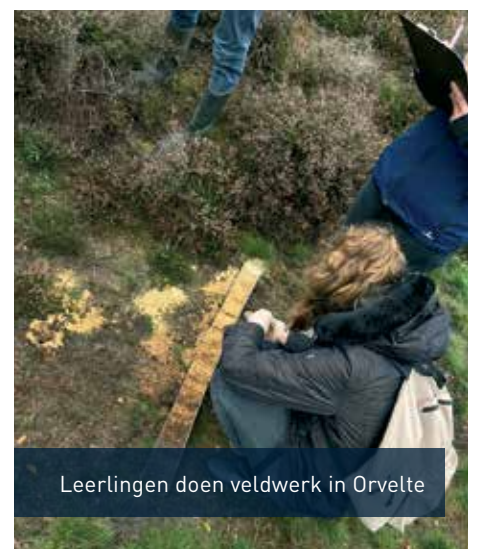
Leerlingen doen veldwerk in Orvelte