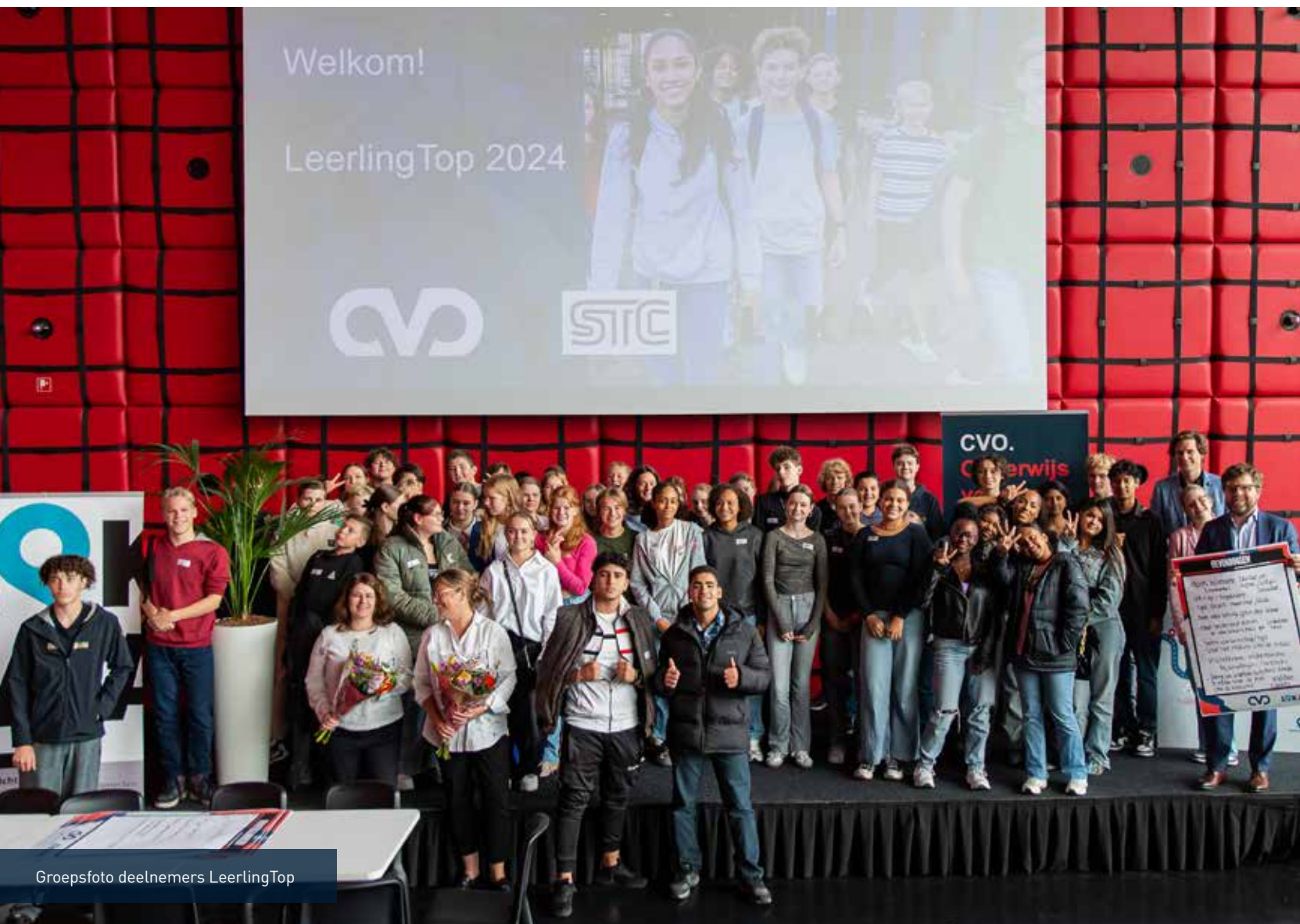
Groepsfoto deelnemers LeerlingTop